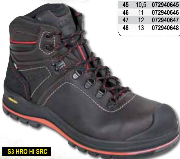
S3 HRO HI SRC