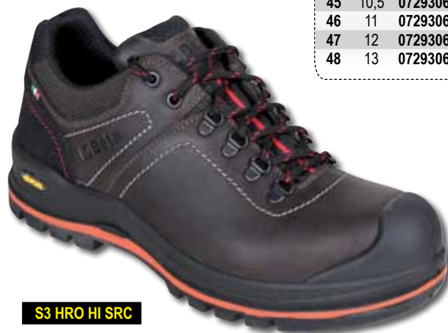
S3 HRO HI SRC