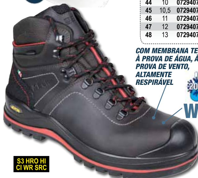
S3 HRO HI CI WR SRC